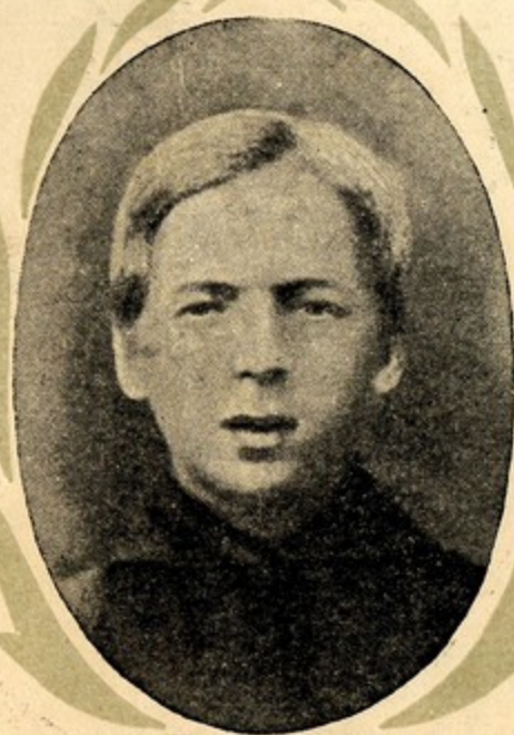
М. М. ИПОЛИТОВ-ИВАНОВ в 1868 году (9-ти лет).