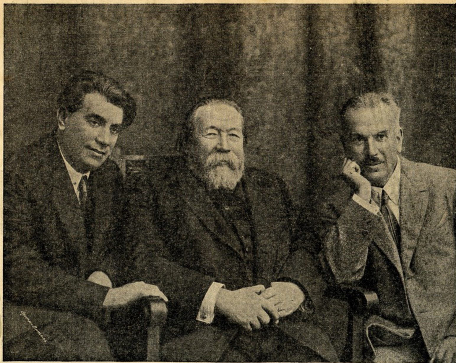
М. М. ИПОЛИТОВ-ИВАНОВ среди своих учеников: Р. М. ГЛИЭРА (слева) и С. Н. ВАСИЛЕНКО (справа).